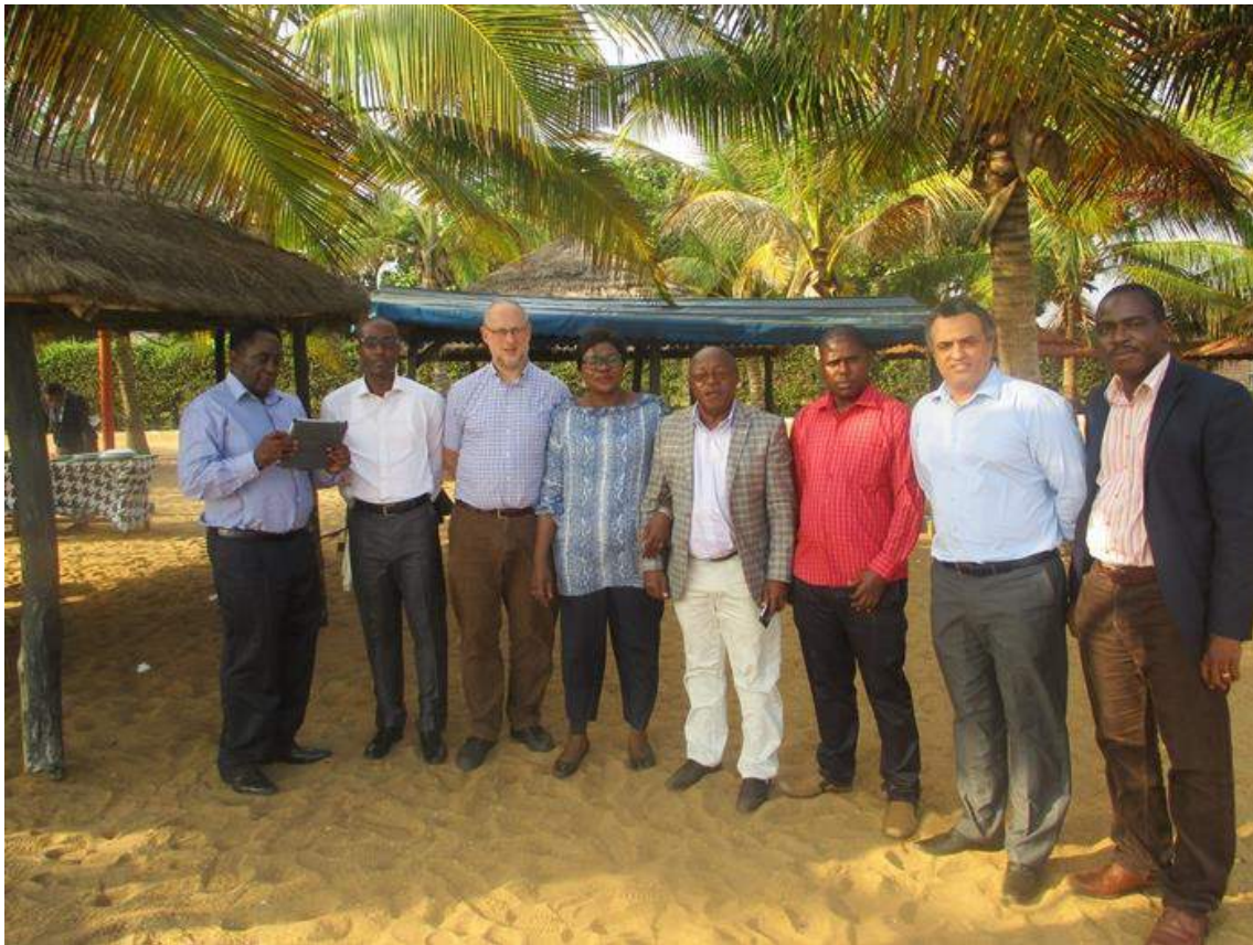
Membres du Conseil d'Administration