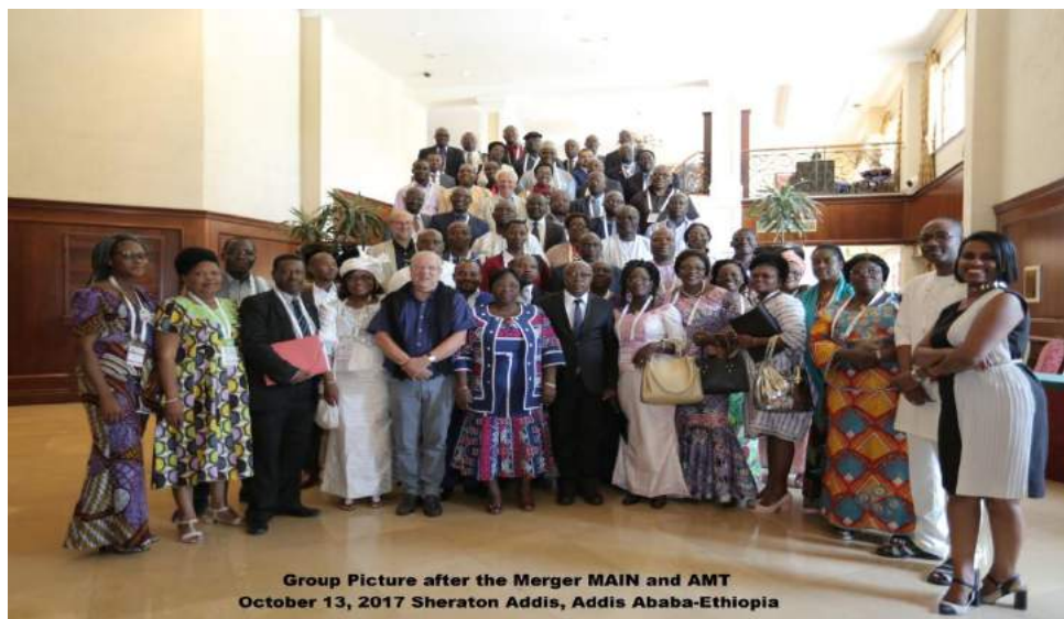
Group Picture after the Merger MAIN and AMT October 13, 2017 Sheraton Addis, Addis Ababa-Ethiopia

A cette occasion, les Présidents des deux réseaux ont réitéré la nécessité et leur volonté de voir cette fusion devenir rapidement effective et ont salué l'engagement et le soutien des membres dans tout ce processus. Un appel a été lancé aux membres de l'AMT qui ne sont pas encore membres du réseau MAIN de le faire afin que les activités sur la Transparence puissent se poursuivre. Après la fusion, les membres de AMT deviennent membres de MAIN et doivent se conformer aux dispositions de MAIN