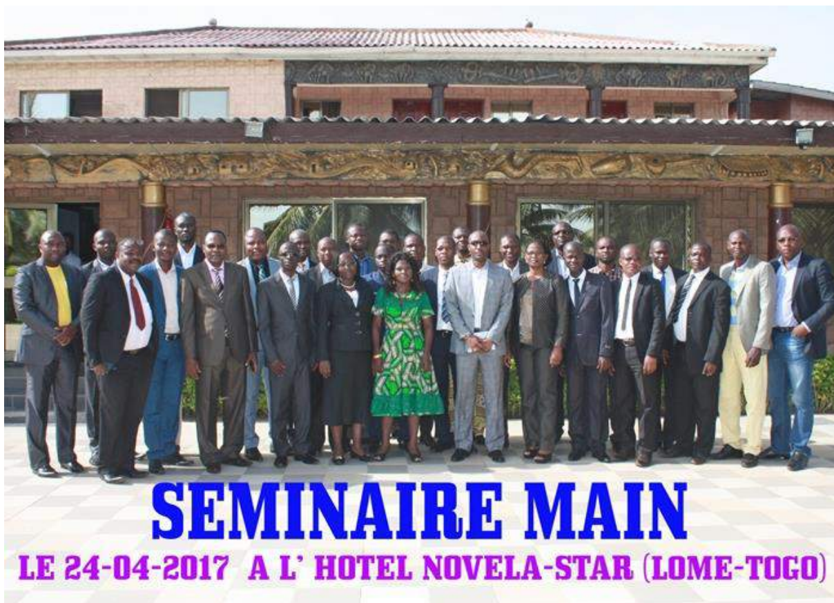
Photo de groupe des participants à la formation