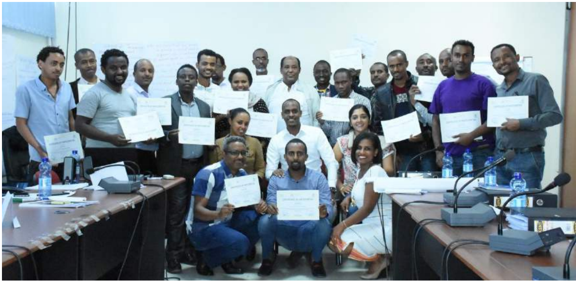
Photo de groupe des participants à la formation