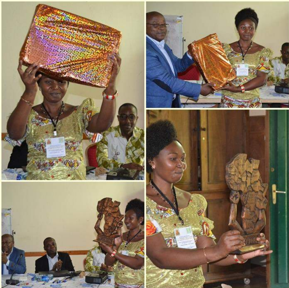
Remise de prix de la meilleure participante à la session

Le Président du MAIN dans ses mots de clôture a remercié les organisateurs (MAIN & GAMF) pour cette initiative conjointe, a exhorté les participants à faire bonne utilisation des acquis de la formation et souhaité bon retour aux participants dans leur pays respectifs.